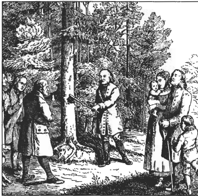
莫拉維宣教士伐木為生

「耶穌對他說，你要盡心、盡性、盡意，愛主你的神。這是誠命的第一，且是最大的。其次也相做，就是要愛人如己。這兩條誠命，是律法和先知一切道理的總綱。」——太廿二 37-39