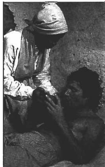
莫拉維宣教士受不住熱帶氣候，染上虐疾，本地人愛心服事他們。

在此我們看見雙職事奉的價值。當正規宣教士對於創啟世界不得其門而入的時候，雙職工人則有特殊方便，誠如叔博士所說，「創啟世界歡迎有助於他們建設的人士入境，包