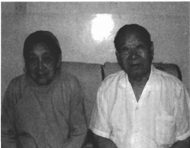
烏魯木齊劉老弟兄及師母

絲網路的異象，也引導一些宣教先鋒踏上了這條宣教路，組成了「遍傳福音團」及「西北靈工團」。