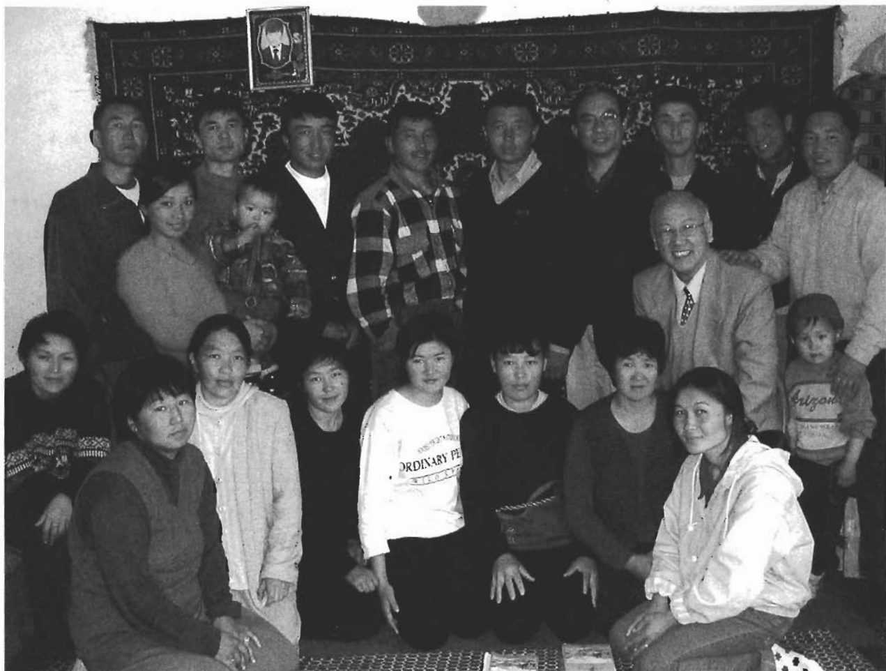
作者與吉爾吉斯教會會友

剛從吉爾吉斯回到休士頓，風和日麗代替了冰天雪地，轉眼新年已來臨，在過去十四個月裡，有三次宣教共七個月在「西域」渡過。隻身在外，蒙主保守，並承妻子獨撐家計，及眾肢體代禱、奉獻支持事工開銷，在主裡獻上感謝。願賜種子給撒種人的主多多加給你們種地的種子，又增添你們仁義的果子，使