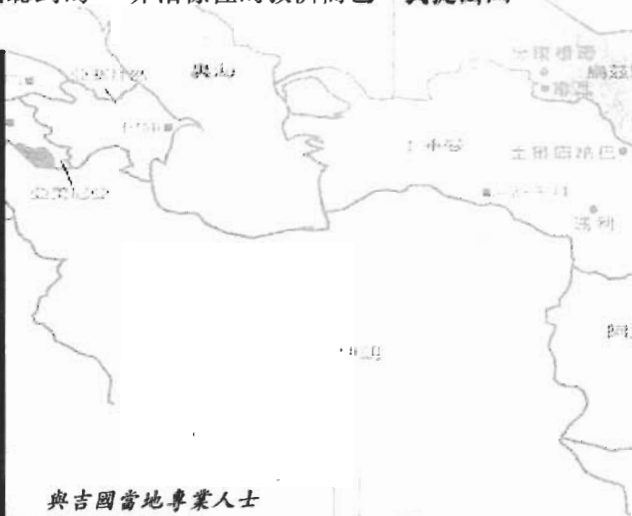
與吉國當地專業人士