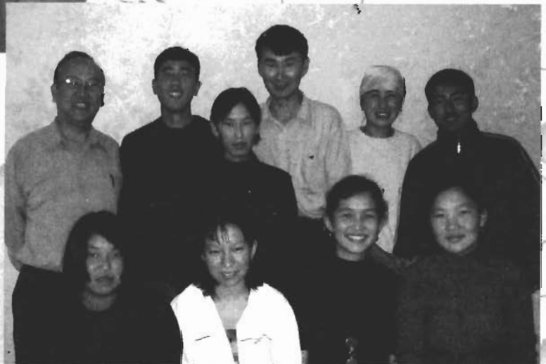
作者與英語查經班同學們