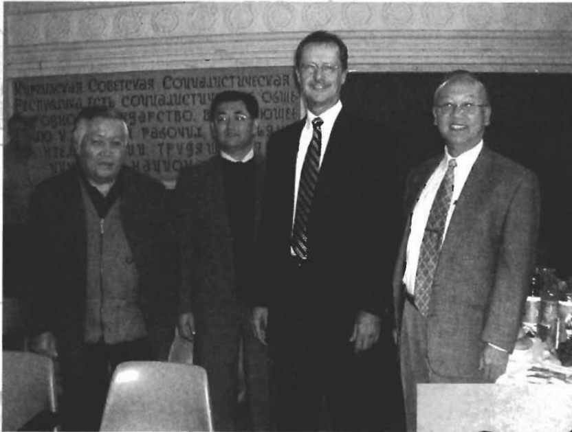
作者擔任當地美國大學顧問，與該校校長及職員合照