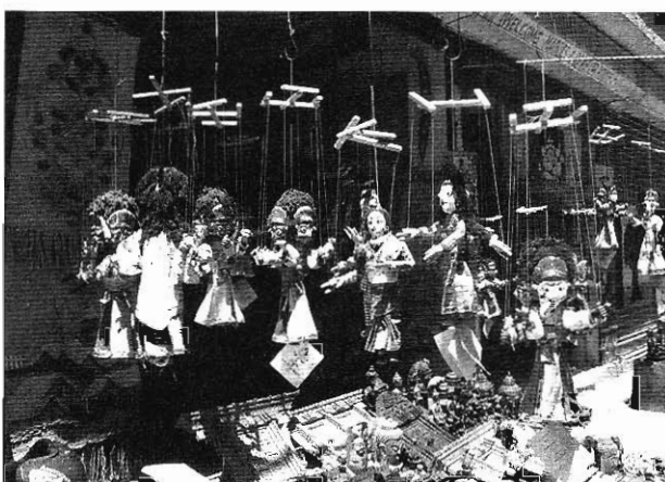
印度教的神像木偶，面目猙獰