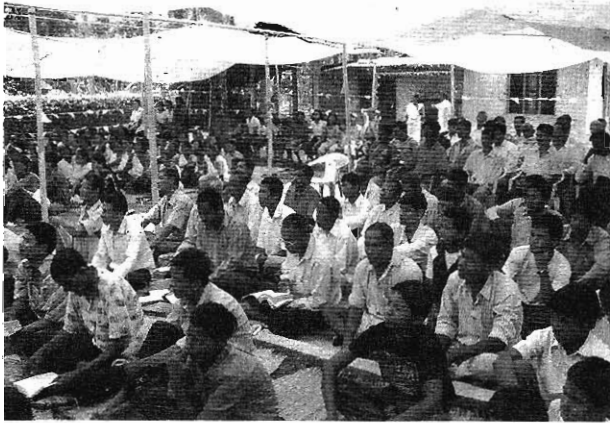
七間教會聯合露天崇拜，數百人出席