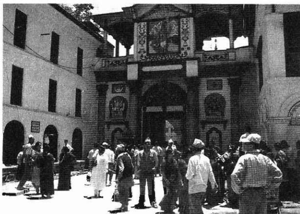
印度教神廟，遊人如鯽