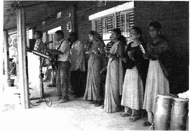
崇拜中獻唱的隊伍