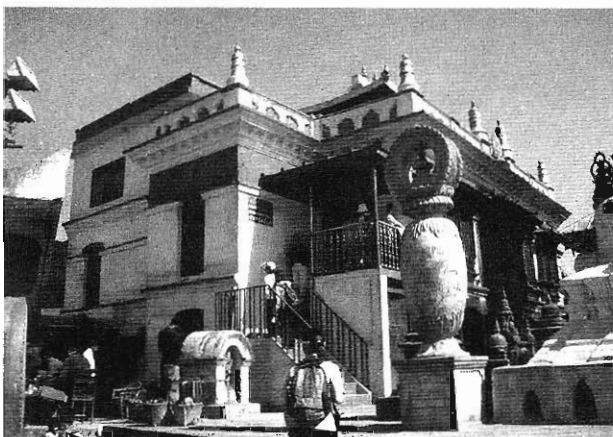
最古老的佛教聖跡之一——加德滿都的朵那克車會古廟

神的國屬於所有人，只要他們願意成為神國子民。所以，有婆羅門成為了基督徒，並且委身福音工作，專事帶領少數民族成為神國子民。山上的居民成為了基督徒，一所一所的教會在此建立。信徒有接受神學栽培，立志作傳道人，也有參與譯經的