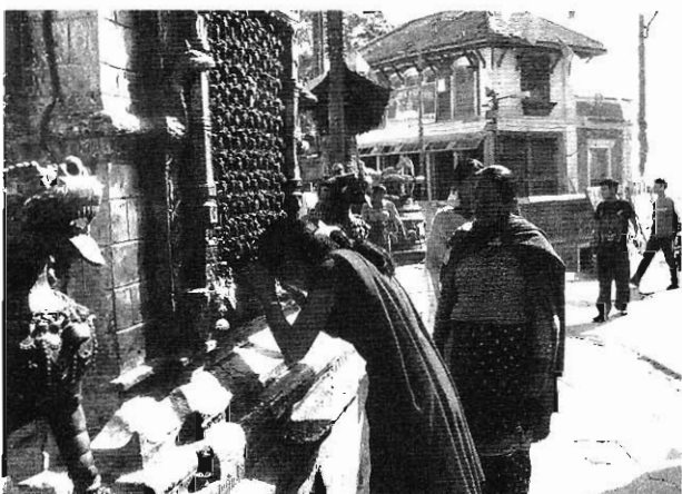
藏傳佛教寺外，婦女在虔誠禮拜