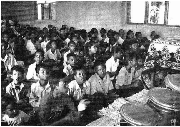
尼泊爾東部低地的教會聚會