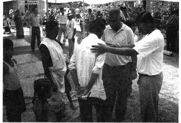
尼泊爾的信徒很重視禱告