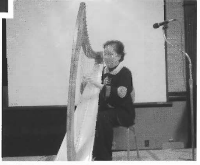
劉李望一師 母豎琴彈奏 「回家吧」 一曲。