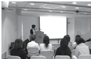
與香港宣道差會 於6月16-17日合 辦導師訓練班