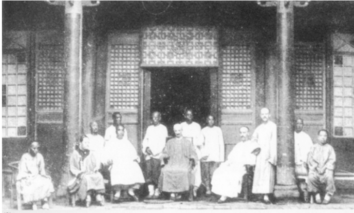
山西洪洞教會的中西同工合影於會堂前（1891）

有愛心、智慧與能力。在他看來，人生最重要的事情只有一件：愛主耶穌，愛人的靈魂。他把自己所有的一切，包括時間、金錢、家庭、朋友和自己的生命，全都放在祭壇上面。他的靈修，他的虔誠，他的講道，他的牧養，無不令人信服，無不與他牧師的職份相稱。他兼具秀才和牧師兩種身份，有豐富的中國傳統文化知識，也有豐富的基督教知識，在兩者的融合上他作出獨到的貢獻。他還寫了很多膾炙人口的白話詩，清新典雅，配上樂曲，唱起來琅琅上口，深受信徒們喜愛。