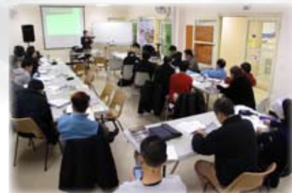
第一個週末在悉尼澳北宣道會教授普宣課程