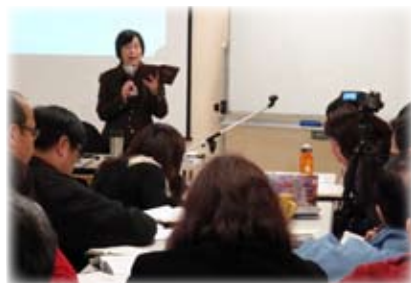
第二個週末在悉尼播道會靈福堂講授普宣課程