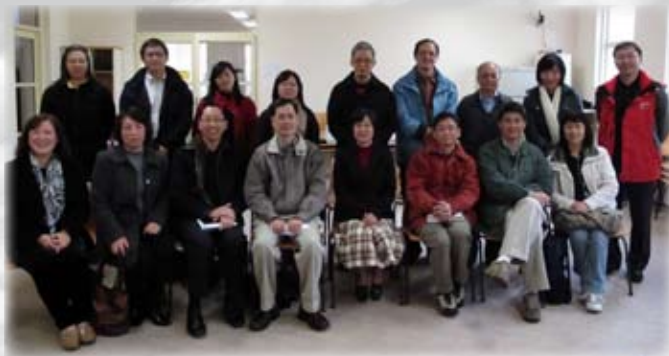
教牧同工講座後合攝

陳博士除應邀到悉尼講學，也在6月7至9日到紐西蘭奧克蘭主講宣教聚會並介紹普世宣教課程，及探訪當地同工及機構。感謝神，大家有美好交通，在宣教事奉上彼此都得著激勵！