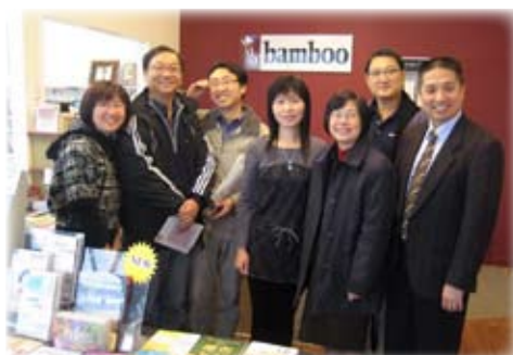
與同工參觀OMF書室合攝