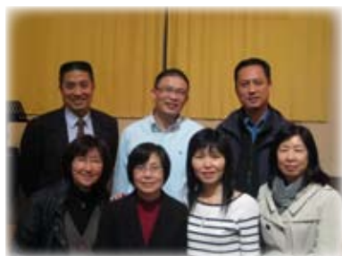
與三對籌委夫婦合攝