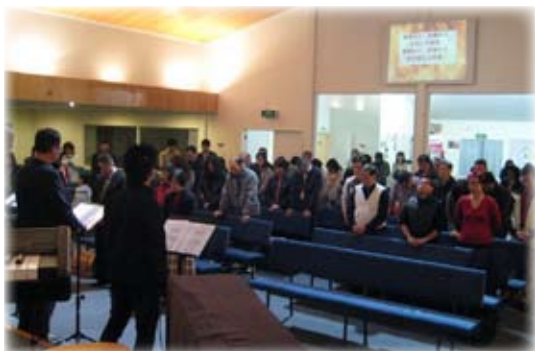
在奧克蘭的公開聚會