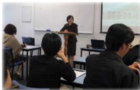
在克里浸信會神學院中文部主講「福音絲綢路」