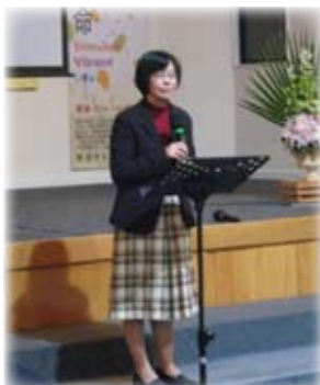
在奧克蘭東區浸信會聚會上攝