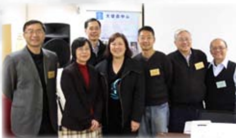
籌備是次教學之旅的委員

陳博士除應邀到悉尼講學，也在6月7至9日到紐西蘭奧克蘭主講宣教聚會並介紹普世宣教課程，及探訪當地同工及機構。感謝神，大家有美好交通，在宣教事奉上彼此都得著激勵！