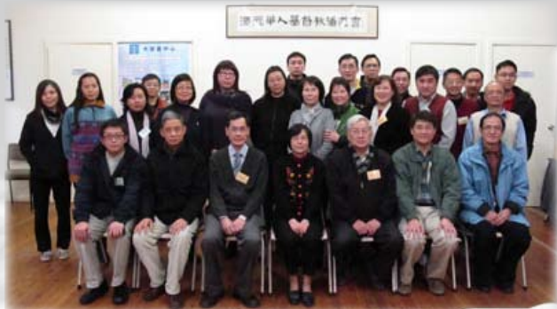
參加普世宣教課程的教牧同工及教會領袖合攝