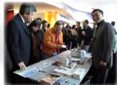
在播道會靈福堂的展攤