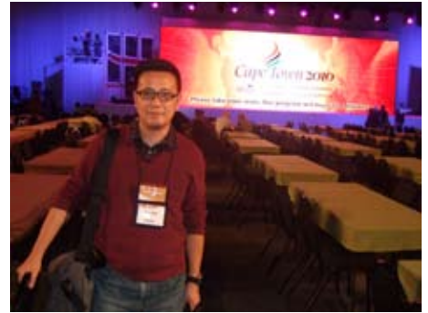
作者於大會會場