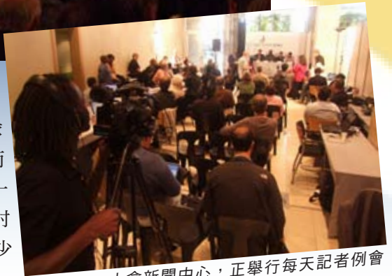
大會新聞中心，正舉行每天記者例會

今次香港《時代論壇》參與洛桑大會的採訪工作，其實並不單作為大會發放消息渠道的指定媒體，更是參與大會採訪工作的註冊媒體（Accredited Media）。這些媒體大多屬基督教界，來自全球各地。而大會對註冊媒體亦相當信任，沒有任何指定的採訪題材與要求，各媒體可以自由策劃各項的採訪工作。