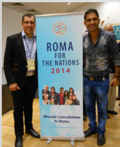
兩位年青羅姆人弟兄分別擔任講台上的主席(左)和傳譯(右)