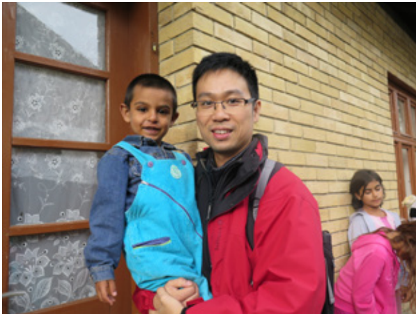
作者與羅姆人小孩