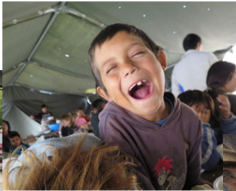
活潑的羅姆人小孩，在穿了洞的帳棚下吃熱湯