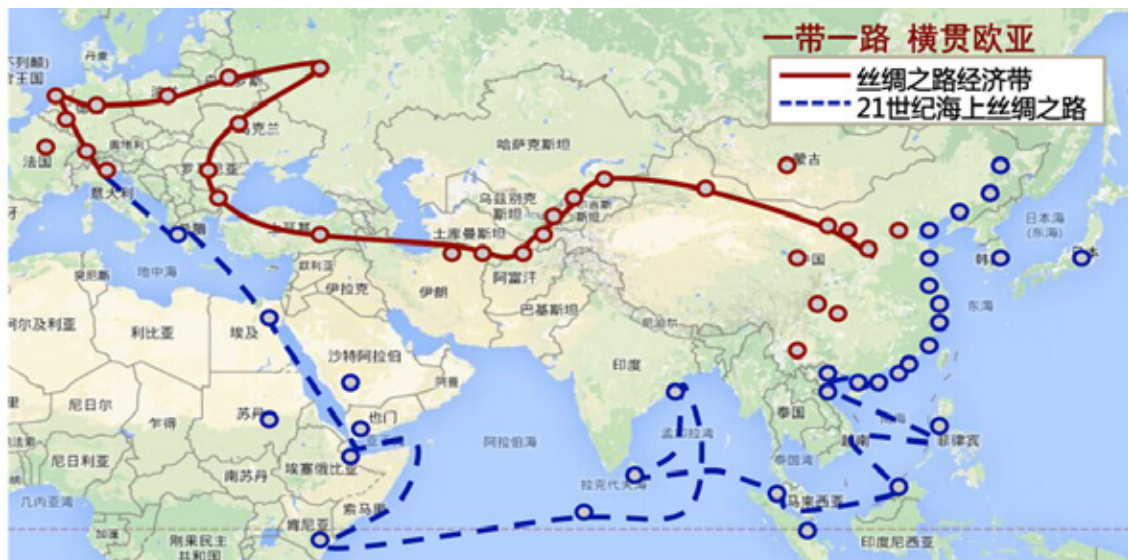
圖一：「一帶一路」橫貫歐亞 1

「一帶一路」涵蓋了65個核心國家，覆蓋面積達5,539km 2 ，約佔全球總面積的41.3%。涵蓋的人口為46.7億，約佔全球總人口的66.9%。 2 「一帶一路」是對古絲綢之路的傳承和提升，將成為中國與